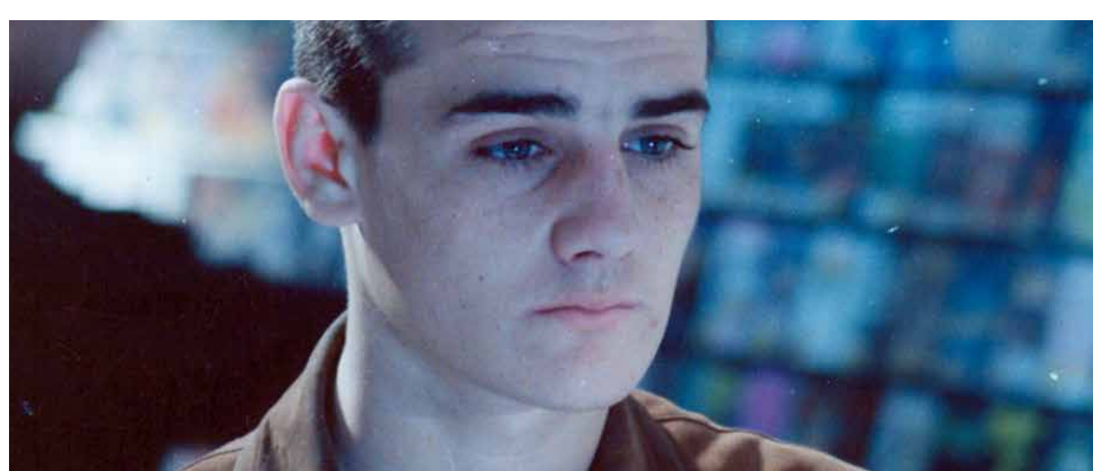
Rapado (Dir. Martín Rejtman, 1992)

4:00 p.m. Corpus Christi (Dir. Jan Komasa. 2020) Polonia. 116 min